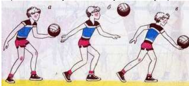
Рисунок 1 – Нижняя прямая подача

Нижняя прямая подача (см. рис. 1) выполняется из положения, при котором игрок стоит лицом к сетке, ноги в коленных суставах согнуты, левая выставлена вперед, масса тела переносится на правую стоящую сзади ногу. Пальцы левой, согнутой в локтевом суставе руки поддерживают мяч снизу. Правая рука отводится назад для замаха, мяч подбрасывается вверх-вперед на расстояние вытянутой руки. Удар выполняется встречным движением правой руки снизу-вперед примерно на уровне пояса. Игрок одновременно разгибает правую ногу и переносит массу тела на левую. После удара выполняется сопровождающее движение руки в направлении подачи, ноги и туловище выпрямляются.